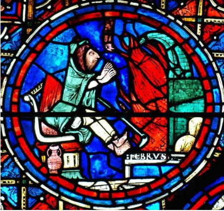
Fragment dels Vitralls de la Catedral de Chartres (segle XIII), representant el mes de febrer, en aquest cas un home escalfant-se prop d'un foc.

Febrer –del llatí februarius ‘mes de les purificacions’– era l'últim mes de l'any abans de la reforma del calendari efectuada per Juli Cèsar el 46 a. C. La seva reforma pretenia adaptar definitivament el calendari al cicle solar de 365'25 dies, afegint-ne un al febrer cada quatre anys. Aquest dia rebia el nom de bisextus ante calendas marti , d'on prové l'actual denominació de bixest o any de traspàs.