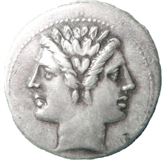
Representació del déu Janus en una moneda romana.

Per això, estaven dedicats a ell el primer mes de l'any, els matins i el primer dia de cada mes, anomenat en llatí calendas , mot del què procedeix el nostre de 'calendari'.